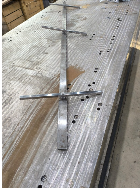
Atölye ortamında masterın makas göbeği kontrolü için hazırlanmış görünümü.

Net değerlendirme: Bu master, makas göbeği / frog / heart bölgesinin fonksiyon ve yüzey geometrisi kontrol mastarıdır. Özellikle tekerleğin göbek üzerinden çarpma yapmadan, düşmeden, yanlış yönlenmeden ve güvenli şekilde ilerlemesini sağlamak için kullanılır.