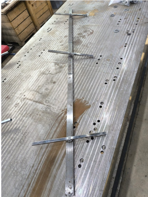
Mastarın göbek bölgesi üzerinde yerleşimi