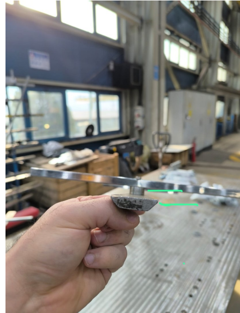
Seviye farkı ve temas yüzeyi kontrol noktası