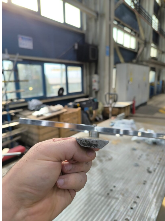
Mastar üzerinde yatay kontrol kolları ve merkez referans bağlantıları görülmektedir.