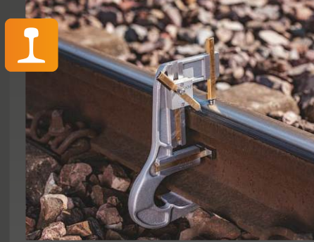
SKM Mekanik Ray aşınma ölçüm cihazı

Onay: DB Uygulama: Analog ölçüm cihazı kontrol etmek için • ray yüksekliği • ray kenarı kenarının aşınması