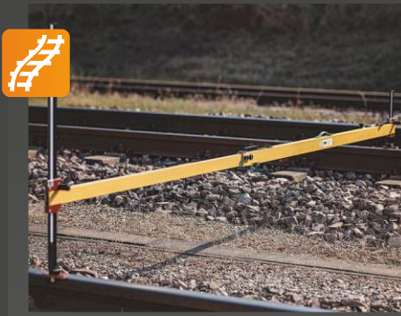
SA 75 Ray açıklığı ölçüm cihazı

Uygulama: Analog ölçüm cihazı, ölçüm yapmak için • iki ray hattının birbirine olan uzaklığı • bir ray hattının sabit bir noktaya olan mesafe ve yükseklik farkı