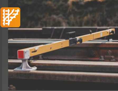
RCA Ray açıklığı ve Dever ölçüm cihazı

Onay: DB, SNCF, SŽ Uygulama: Makaslar ve raylar için ray açıklığını • eğimi • flanş yolu boşluğunu • ray açıklığını kontrol etmeyi • dıştan-dışa mesafeyi