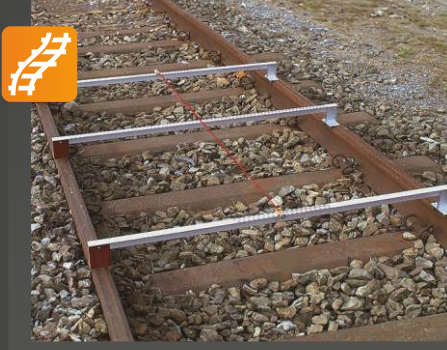
BM Hizalama için ölçüm çubukları „Wuppertaler yöntem“

Onay: DB Uygulama: Analog cihaz ölçmek için verilir