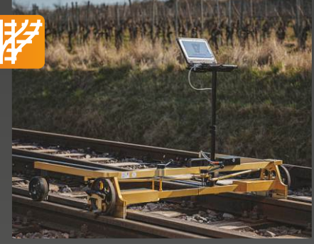
MessReg CDM Ray ve makas muayene sistemi

Onay: DB Uygulama: Otomatik ve sürekli olarak ray ölçüsü • eğim • flanş yolu açıklığı • ray ölçüsünü kontrol etme • sırt sırta mesafe • burulma • mesafe • flanş yolu derinliği (isteğe bağlı) ölçümü için açık hava not defteri ve değerlendirme yazılımı içeren dijital ve mobil ölçüm sistemi