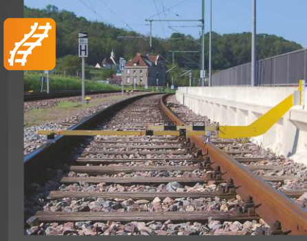
BOŞLUK TESPİTİ MUL Alt yapı boşluğu için ölçüm cihazı

Uygulama: Ölçmek için analog cihaz • köprü ve platformlardaki alt yapı boşluğu • hemzemin geçitlerde don hasarları