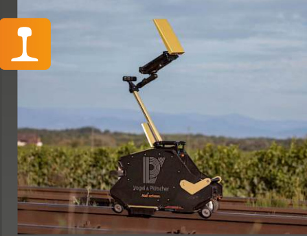
RSCM Ray yüzey muayene sistemi

Onay: DB Uygulama: 7 mm'ye kadar ray yüzeyine yakın kusurların tespiti için dış mekan tableti de dahil olmak üzere dijital, mobil muayene sistemi, örneğin • çukurlaşma / metal kaybı • yuvarlanma teması yorgunluğu (RCF) • mantar kontrolleri • yaralanma