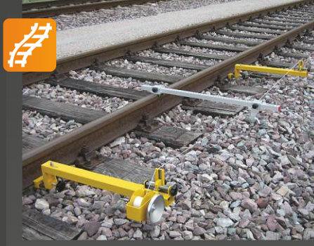
PFIA 1 Genel amaçlı hizalama ölçme cihazı

Uygulama: Analog ölçüm cihazı, • kavisli bir hattın iç ve dış kısmının ölçülmesi