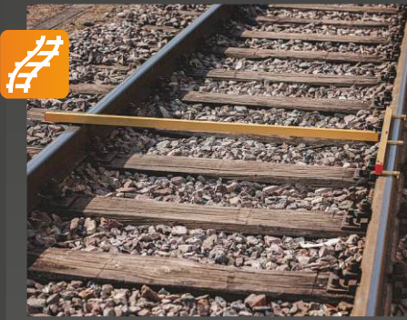
SQUARE Hat diklik tespiti

Uygulama: Analog ve ayrılabilir ölçüm cihazı, desteklemek ve kontrol etmek için • traverslerin hizalanması