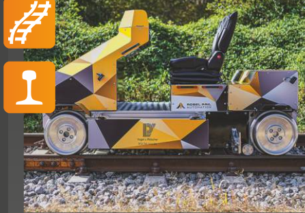
ROSPECT Modüler muayene platformu

Uygulama: Otomatik muayene aracı • Eddy akımı ve ultrasonik ile ray arızalarının tespiti • ölçümü - MessReg IMU (Ölçüm Ünitesi) aracılığıyla hat geometrisi - ray uzunlamasına profili (oluklu) - ray enine profili - Taban penetrasyon radarı