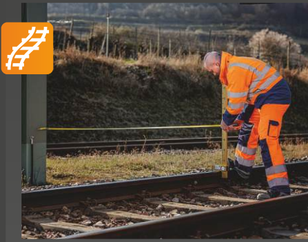
POINT Sabit nokta ölçüm cihazı

Uygulama: Analog ölçüm cihazı yani sinyal direği, beton duvarlar, vb.) arasındaki mesafeleri raylara göre ölçüm • uygun bir ölçüm göstergesi kullanarak bireysel seviye değerlerini kontrol edin