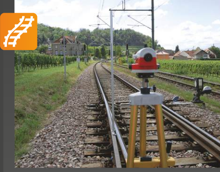
VIG 1300 Görüntüleme ve seviyeleme cihazı

Onay: DB, SNCF (görüntüleme alma işlevi) Uygulama: Leica optikli ölçüm cihazı • İz boyunca yüksekliği belirlemek için görüntüleme • Ray yüksekliğini belirlemek için seviyelendirme