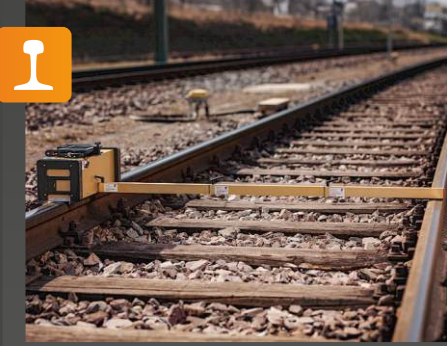
RM 150HR Ray yüzey kalitesi için ölçüm sistemi

Onay: DB Uygulama: Açık hava tableti ve değerlendirme yazılımı dahil olmak üzere dijital ve taşınabilir ölçüm sistemi • ray yüzey kalitesi endeksi [QI]