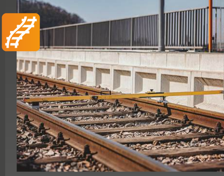
PLAT Platform mesafe ölçer

Uygulama: Analog cihaz ölçmek için merkezinden veya iç ray kenarından platforma olan mesafeler • rayın üstünden platform kenarına veya rampaların üstüne kadar olan yükseklik farkı