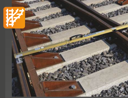
RCAD Demiryolu hat ve makas ölçümü. Dever ölçme cihazı

Onay: DB, SŽ Uygulama: Hat ve Makas geometri ölçümü için Hat açıklığı • eğimi • flanş yolu açıklığını • ray göstergesini kontrol etmeyi • sırt sırta mesafeyi belirlemek için dijital ölçüm cihazı