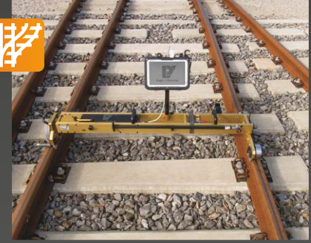
MessReg CTS II Ray ölçüm sistemi

Uygulama: Otomatik ve sürekli ray ölçümü • eğim • burulma • mesafe