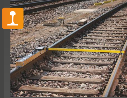
RM 1200 D Uzunlamasına profil ölçüm sistemi (taşınabilir)

Onay: DB Uygulama: Açık hava tableti ve ray uzunlamasına profilini (oluklu) • kaynak bağlantılarını yakalamak için değerlendirme yazılımı içeren dijital ölçüm sistemi