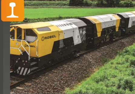
ROMILL Demiryolu bakımı için komple çözüm

Uygulama: En son frezeleme, taşlama ve ölçüm teknolojisini birleştiren ray işleme sistemi. Ölçümler şunları içerir: • ray enine profili • ray uzunlamasına profili (oluklu) • ray kusurları