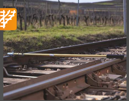
GG 718 Makas dil ucu için şablon sistemi

Onay: DB Uygulama: Analog cihazı kontrol etmek için • Makas dil ucu aşınma kontrolü