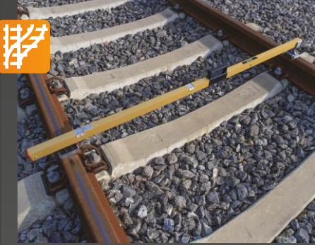
RCS Ray ölçü ve dever ölçüm cihazı

Onay: DB, SNCF, SŽ Uygulama: Raylar için ray ölçü ve eğimi belirlemek amacıyla kullanılan analog ölçüm cihazı