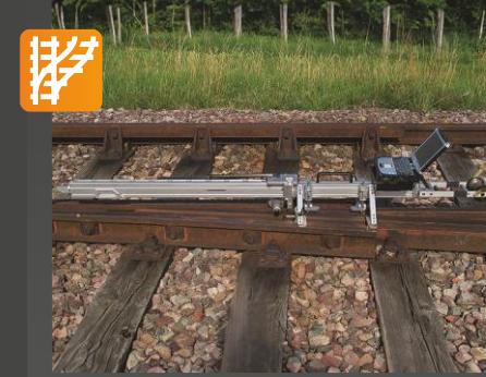
HMG Makas Göbek geometri ölçüm sistemi

Onay: DB Uygulama: Dış mekan için laptop ve değerlendirme yazılımı dahil olmak üzere dijital ölçüm sistemi, tanımlama ve değerlendirme için • Makas göbek ve yüzeyi geometrisi