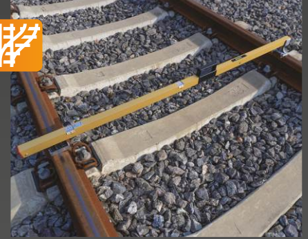
RCFF Ray açıklığı ve dever ölçüm cihazı

Onay: DB, SŽ Uygulama: Ray açıklığı ve eğimi ölçmek için yaylı mekanizma ve kilitleme bloğu ile donatılmış analog ölçüm cihazı