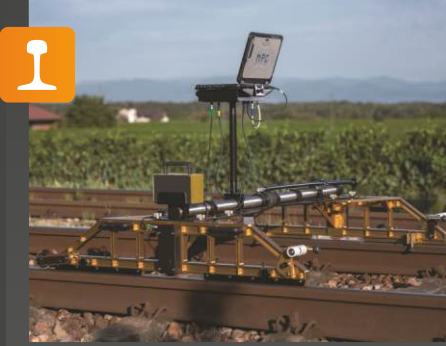
RMF 1100 Uzunlamasına profil ölçüm sistemi (mobil) ,ondülasyon

Onay: DB Uygulama: Otomatik ve sürekli • ray uzunlamasına profili (oluklu) • kaynak eklemi ölçümü için açık hava not defteri ve yazılımı içeren dijital ölçüm sistemi.