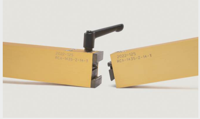
Ayrılabilir tasarım (isteğe bağlı)

Diğer ölçüler için detaylar talep üzerine mevcuttur.