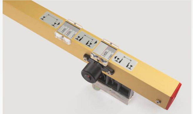
İnce ayar ile hassas ölçümler